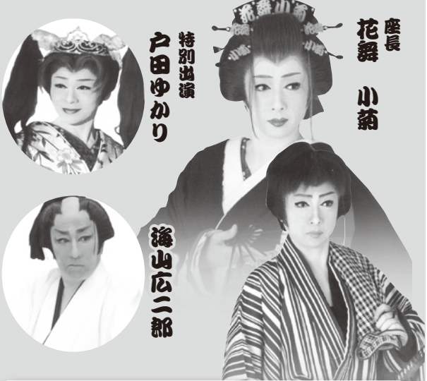
特別出演 戸田ゆかり