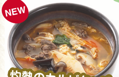
NEW 灼熱のカルピクッパ

5年目を迎える大人気メニュー。名前のアホはスペイン語で「にんにく」のこと。キムチと豚肉を使ったスタミナ満点の一品です。