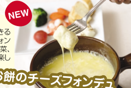
NEW お餅のチーズフォンデュ

カップルやファミリーでシェアできるメニューとして「お餅のチーズフォンデュ」が新登場。地元のお餅や野菜、パンなどをチーズフォンデュでお楽しみください。